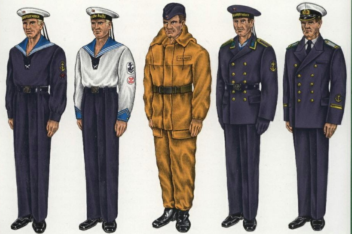
Dienstanzug-Sommer für Matrosen und Maate Ausgehanzug-Sommer für Matrosen und Maate Gefechtsanzug Ausgehanzug-Winter für Matrosen und Maate Ausgehanzug-Sommer für Offiziere