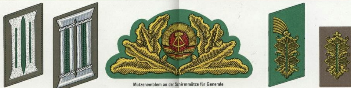
Kragenspiegel für Uffz und Soldaten Kragenspiegel für Offiziere und Fähriche Kragenspiegel und Arabeske für Generale