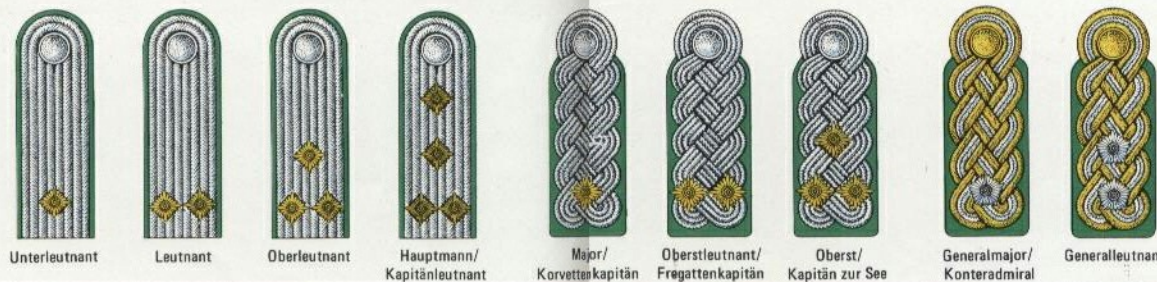
Unterleutnant Leutnant Oberleutnant Hauptmann/Kapitänleutnant Major/Korvettenkapitän Oberleutnant/Fregattenkapitän Oberst/Kapitän zur See Generalmajor/Konteradmiral Generalleutnant