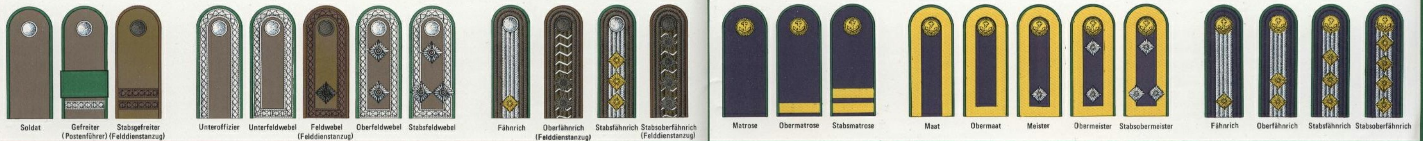
Soldat Gefreiter (Postenführer) (Felddienstanzug) Stabsgefreiter (Felddienstanzug) Unteroffizier Unterfeldwebel (Felddienstanzug) Feldwebel (Felddienstanzug) Oberfeldwebel Stabsfeldwebel Fähriche (Felddienstanzug) Oberfähriche (Felddienstanzug) Stabsfähriche (Felddienstanzug) Stabsoberfähriche (Felddienstanzug) Matrose Obermatrose Stabsmatrose maat Obermaat Meister Obermeister Stabsobermeister Fähriche Oberfähriche Stabsfähriche Stabsoberfähriche