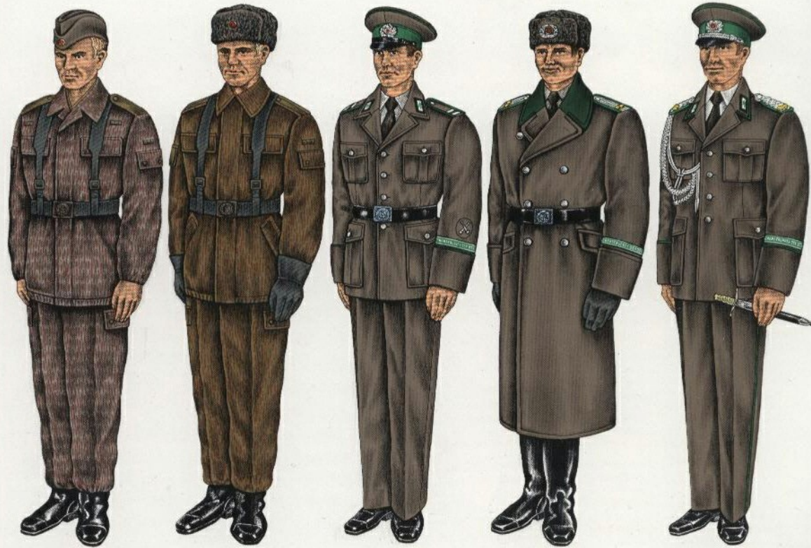
Felddienstanzug-Sommer Felddienstanzug-Winter Ausgehanzug-Sommer für Soldaten und Uffz Dienstanzug-Winter für BerufsUffz, Fähriche und Offz Ausgehanzug-Sommer für BerufsUffz, Fähriche und Offz