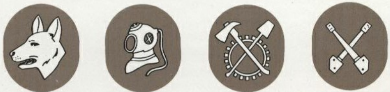
Diensthundeführer Taucher Pioniere Waffentechnischer Dienst Die Dienstlaufbahnabzeichen werden am linken Unterärmel getragen.