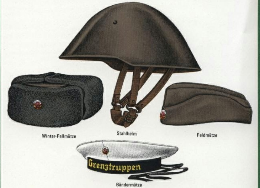
Winter-Fellmütze Stahlhelm Feldmütze Bändermütze Grenztruppen im küstennahen Bereich tragen auf der Bändermütze die Aufschrift "Grenzbrigade Küste"